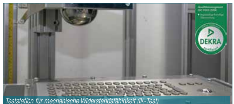
Teststation für mechanische Widerstandsfähigkeit (IK-Test)

Die Tastaturen, die zum größten Teil bei uns am Standort gefertigt werden, durchlaufen einen strikten Qualitätsprozess. Jedes Gerät wird zu 100 Prozent geprüft, bevor es an unsere Kunden versendet wird. Dadurch zeichnen sich unsere Edelstahltastaturen durch Zuverlässigkeit und Langlebigkeit aus.