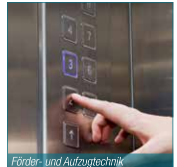
Förder- und Aufzugtechnik