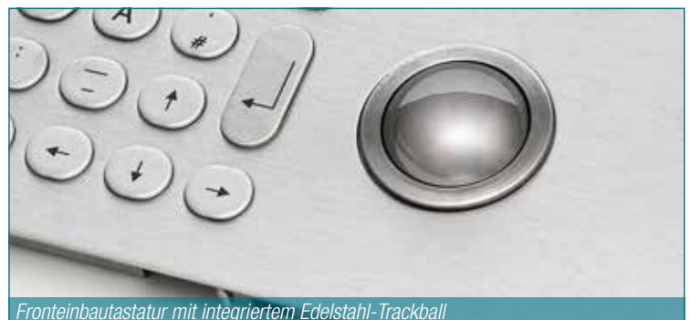
Fronteinbautastatur mit integriertem Edelstahl-Trackball

In diesem Bereich bieten wir ein umfassendes Sortiment an hochwertigen, gebrauchsfertigen Edelstahl-tastaturen. Diese können Sie bei uns einsatzbereit ab Lager beziehen. Grundsätzlich unterscheiden wir zwischen Einbautastaturen für die Systemintegration und Tastaturen im Gehäuse für den Einsatz auf dem Schreibtisch oder in Konsolen. Die Modellbandbreite reicht dabei vom beleuchteten Ziffernblock bis hin zur Einbautastatur mit Trackball.